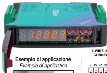
Esempio di applicazione Example of application