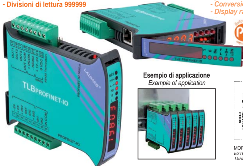
Esempio di applicazione Example of application