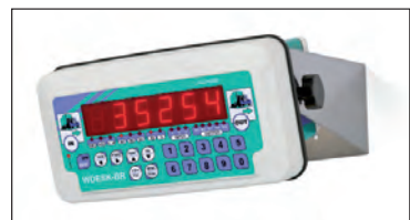
Montaggio a parete (utilizzabile anche su tavolo) Wall mounting (can be used also for desk)

vedi OPZIONI a richiesta / see OPTIONS on request